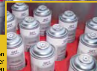
Dosen vor der Explosion

Verschiedene Übungsfuer können am FL 100 Feuertrainer simuliert werden, z.B.: